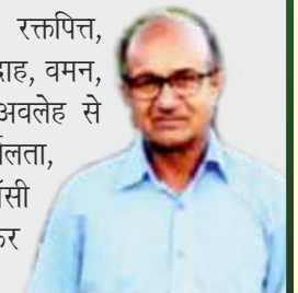
लेखक- डॉ. वेदमित्र आर्य

इसके अतिरिक्त अन्य बहुत से रोगों में अनुपान भेद से द्राक्षा का प्रयोग किया जाता है। द्राक्षावलेह, द्राक्षासव व द्राक्षारिष्ट आयुर्वेद के प्रसिद्ध योग हैं जिन्हें प्रायः सभी कम्पनियाँ बनाती हैं। द्राक्षावलेह, प्रदर, वेदनायुक्त कुक्षिशूल, बस्तिशूल और योनिशूल आदि रोगों को दूर करता है। स्त्रियों के लिए अत्यन्त हितकारी है। जीर्ण रक्तपित्त, रक्तातिसार, रक्तार्श, मूत्र रोग, दाह, वमन, चक्कर आना आदि रोग इस अवलेह से ठीक हो जाते हैं। द्राक्षासव दुर्बलता, भूख न लगना, अजीर्ण, खाँसी आदि रोगों में अत्यन्त लाभकर है।